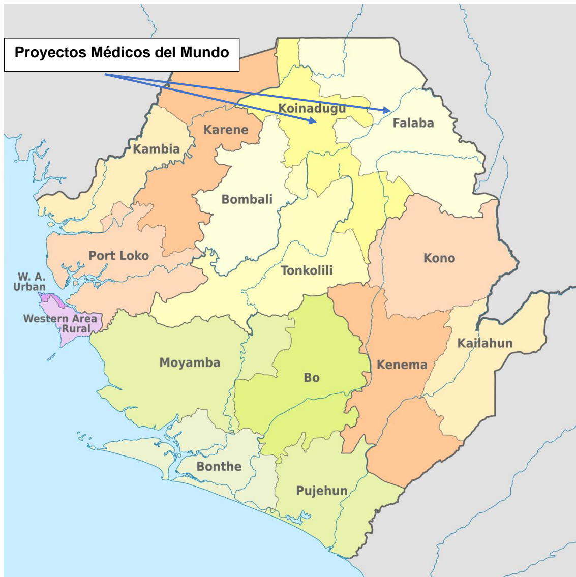
Imagen 2: Mapa de las localizaciones de los proyectos en Sierra Leona

Las líneas sectoriales prioritarias para los nueve proyectos son: Derechos a los bienes públicos ( Acceso a la salud preventiva y primaria, con especial atención a la salud sexual y reproductiva ) y Derechos de las mujeres. Los cinco los proyectos de Medicus Mundi en Malí priorizan además la línea sectorial: Derecho a Ingresos Dignos.